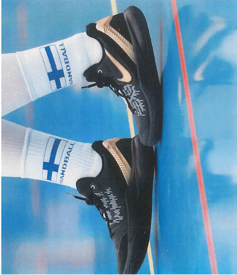
Matti Matkainen / Newspix24