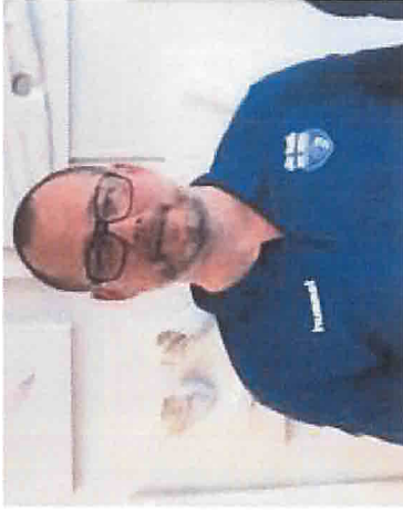
Tomas Westerlund aloitti naisten maajoukkueen päävalmentajana syksyllä 2019. Tavoitteena on jatkaa hyvää kehitystä ja katsoa pidemmälle tulevaisuuteen vuoden 2024 EM-kisoihin.

/// Suomalainen käsipallo on mennyt paljon eteenpäin, joten on mielenkiintoista nähdä, miten pitkälle voimme päästä. Kun on tavoitteita, voi syntyä myös tuloksia”, Tomas tuumii.